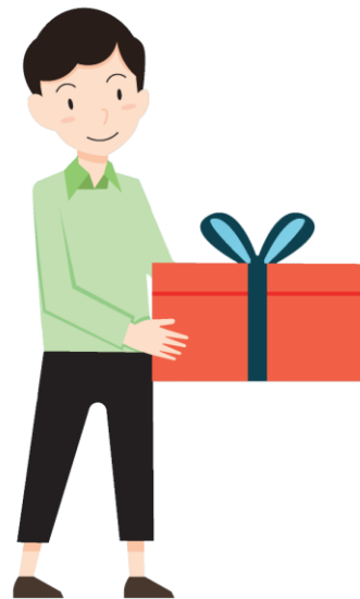
คุณแสนดี ชาวบ้าน