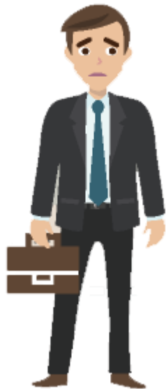
คุณแสนชื่อ นักธุรกิจ