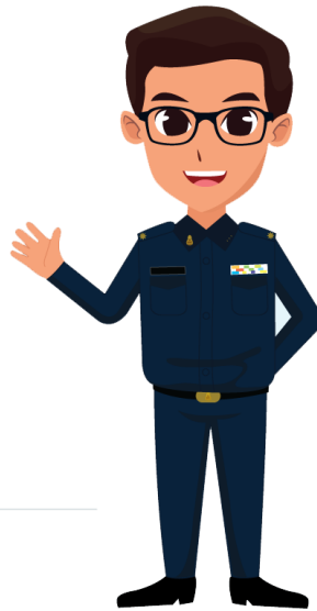
เจ้าหน้าที่ ผู้ให้ข้อมูล

แนะนำตัวละครในบทที่ ๒ บทที่ ๓ และบทที่ ๔